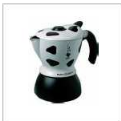
2004 MOKKA EXPRESS