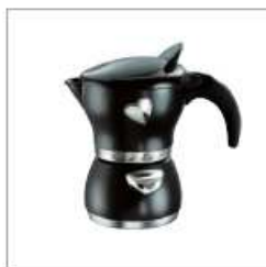
2007 CUOR DI MOKKA