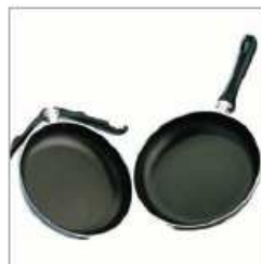
1998 SPAZIO SYSTEM