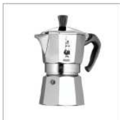
1933 MOKA EXPRESS

n. 443939 del R.E.A. presso C.C.I.A.A. di BRESCIA