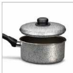
1980 LINEA TRIPLA