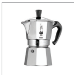
1933 MOKA EXPRES

n. 443939 del R.E.A. presso C.C.I.A.A. di BRESCIA