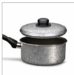
1980 LINEA TRUD