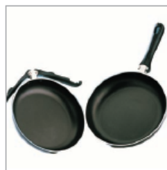
1998 SPAZIO SYSTEM