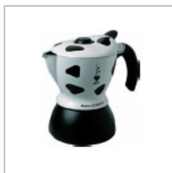
2004 VIUKKA EXPRES