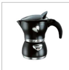
2007 CUOR DI MOKA